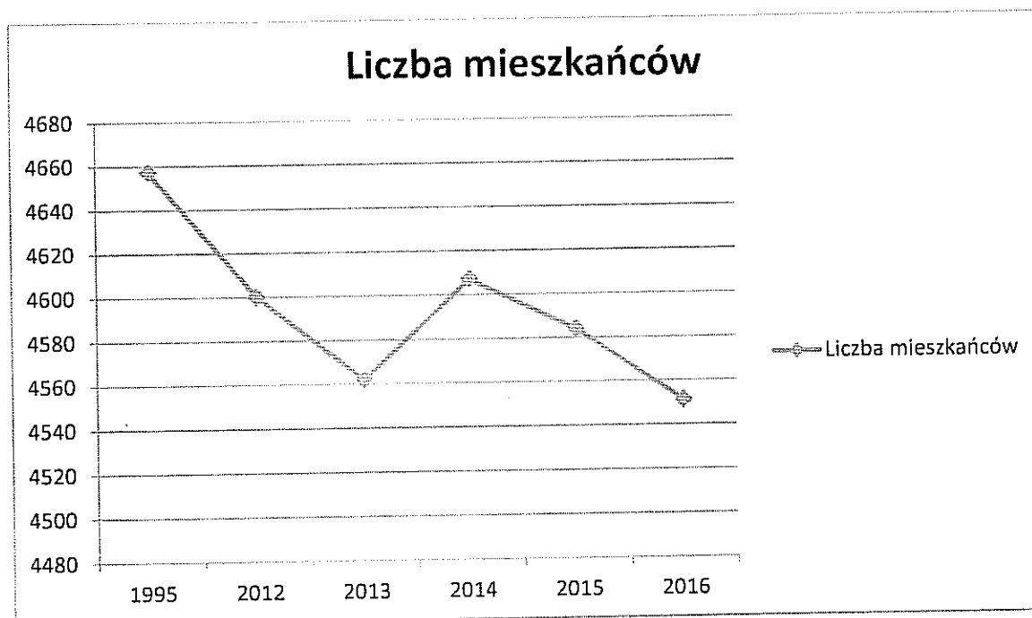
Wykres 1. Liczba mieszkańców Gminy Paradyż

Powyższy wykres przedstawia liczbę mieszkańców gminy w ostatnich latach w porównaniu do roku 1995 r., ponieważ rok 1995 jest rokiem bazowym przy obliczaniu poziomów recyklingu za dany rok. Liczba mieszkańców w ostatnim okresie w porównaniu do roku 1995 maleje.