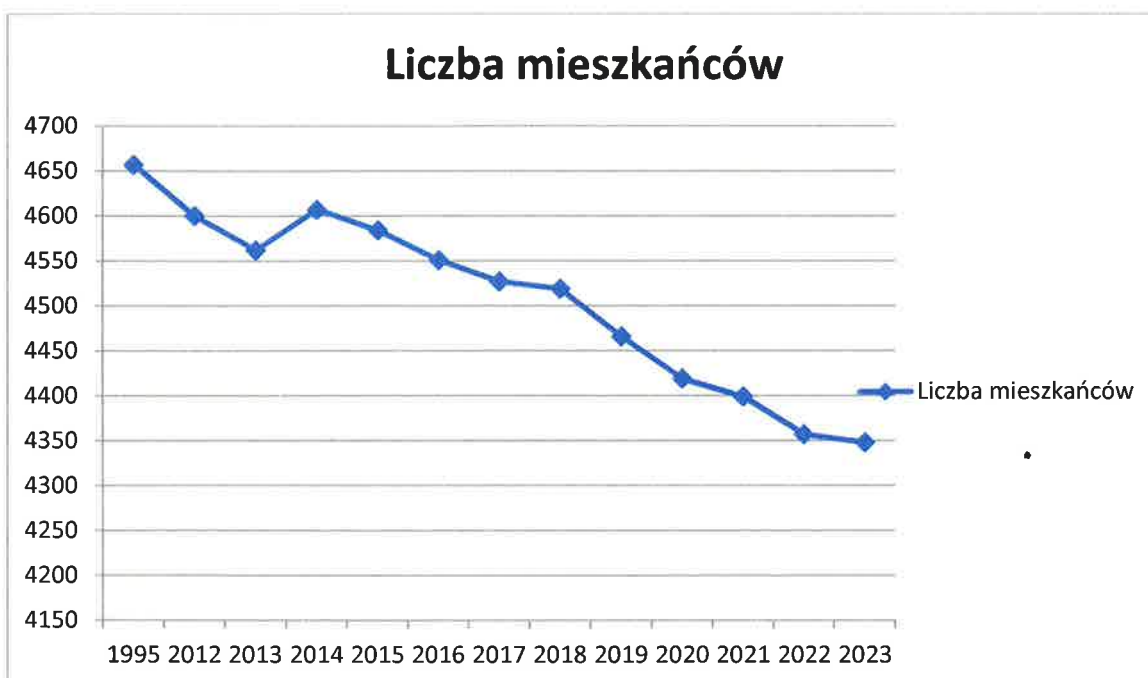
Wykres 1. Liczba mieszkańców Gminy Paradyż

Na dzień 31 grudnia 2023 roku liczba osób zameldowanych na terenie Gminy Paradyż wyniosła 4348 (według danych z Ewidencji Ludności Urzędu Gminy Paradyż), natomiast liczba mieszkańców gminy na podstawie danych pochodzących ze złożonych przez właścicieli nieruchomości deklaracji o wysokości opłat za gospodarowanie odpadami komunalnymi wyniosła 3631. Udział liczby mieszkańców według złożonych deklaracji do liczby mieszkańców według ewidencji ludności wynosi 83,51%.