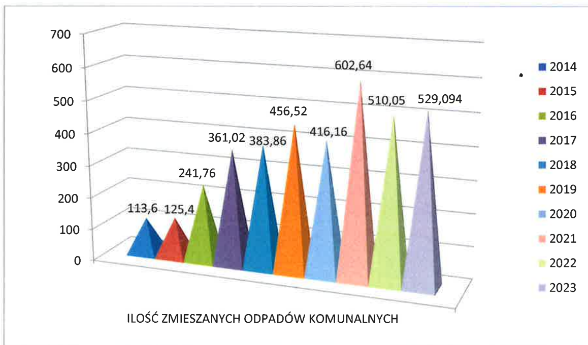
Wykres 2. ILOŚĆ ZMIESZANYCH ODPADÓW KOMUNALNYCH ODEBRANYCH Z TERENU GMINY PARADYŻ w latach 2014-2023