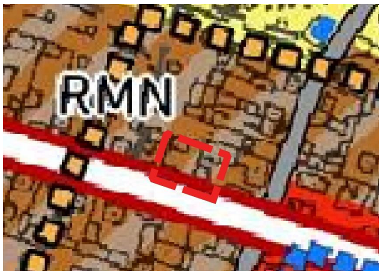
Rysunek 3 Wyrys ze studium uwarunkowań i kierunków zagospodarowania gminy Paradyż dla obszaru opracowania