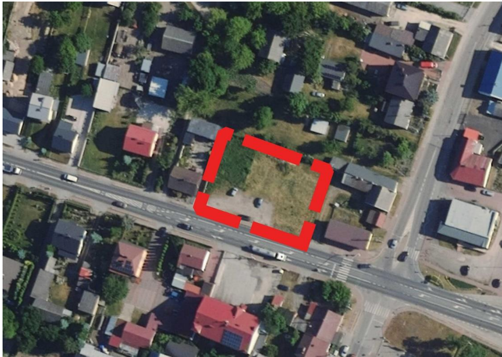
Rysunek 2 Obszar objęty ustaleniami planu miejscowego na tle ortofotomapy.